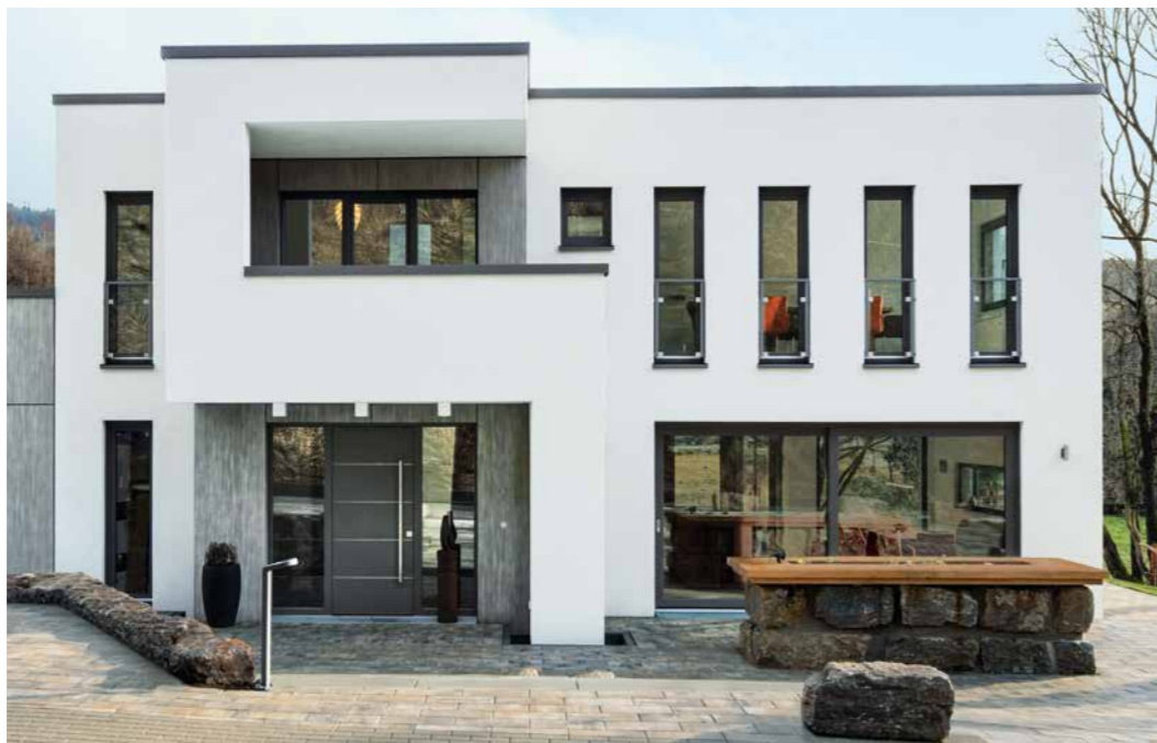
Schüco LivIng forme la base parfaite pour des portes d'entrée modernes, contemporaines.

La porte d'entrée est la carte de visite d'une maison et confère charme et esthétisme à l'entrée. Mais la porte ne doit pas être convaincante uniquement du point de vue esthétique. La fonctionnalité et la longévité sont tout aussi importantes. Avec Schüco LivIng, vous pouvez trouver la porte d'entrée qui satisfait vos exigences. Concevez votre nouvelle porte d'entrée en PVC exactement d'après vos propres idées et en fonction de vos préférences. Parallèlement, Schüco LivIng offre une technologie innovante qui permet une isolation thermique optimale digne d'une maison passive et une protection supérieure contre les effractions jusqu'à la classe de résistance 2 (RC2).